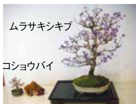
ムラサキシキブ コショウバイ