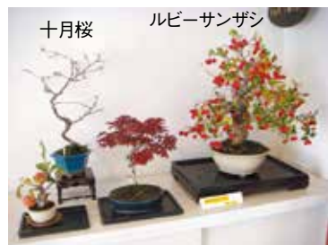
十月桜 ルビーサンザシ ヒメリンゴ シシガンラモジ