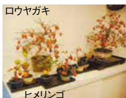
口ウヤガキ ルビーサンザシ ヒメリンゴ