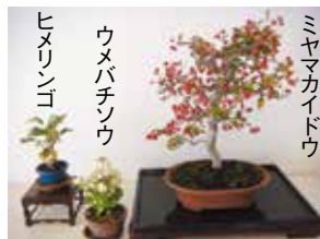
ヒメリンゴ ウメバチソウ ミヤマカイドウ