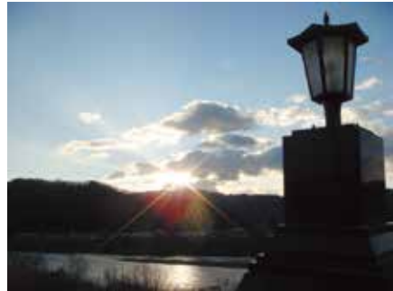
平成27年の初日の出

平成二十七年の新春を迎えました。昨年もいろいろなことがありましたね。画期的で明るいニュースだったはずのSTAP細胞はその存在すら危ぶまれることになりました。失望とともにどうしてこんなことが起こるのか理解できませんでした。そんな理解できない出来事が多すぎる世の中ですね。日本人の品格はどこに行ってしまったのでしょうか？ そんな中での日本人三人のノーベル物理学賞の受賞は文字通り明るく、誇らしいニュースでした。スポーツでは明るいニュースがたくさんありました。テニスの錦織選手やゴルフの松山君や野球のヤンkees、田中君、フィギュアスケートの羽生君そしてバトミントンや卓球の若い力など、海外に出ても堂々と戦うその姿は本当に頼もしい限りです。一方、御嶽山の噴火や、大雨による土石流など痛ましい災害もありました。そして十二月に突然実施された衆議院の解散総選挙には驚きました。最低の投票率を政治家の皆さんは重く受け止めてほしいですね。これからは本当の国民のための政策が迅速に実行されるのを見守るしかないですね。岩谷医院は今年も患者さんのための医療が実行できるようスタッフ一同頑張りますので宜しくお願い致します