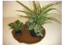
カングミ ヤマアジサイ