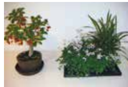
ナツグミ ヤブラン ツクシカラマツ