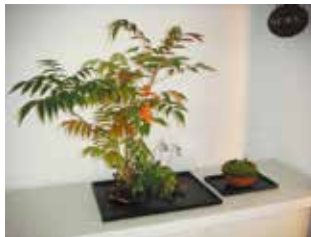
ハゼノキ スナゴケ