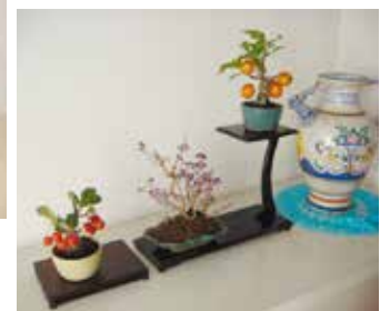
ヒメリンゴ ムラサキシキブ ヒメリンゴ