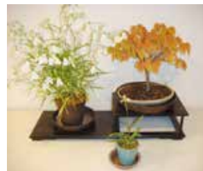
イワシャジン サギソウ ケヤキ